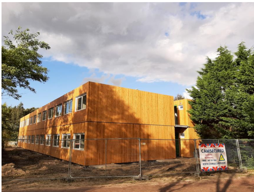
Figuur 3. Woonunits locatie Puikman.

De locatie Puikman is voor minimaal drie jaar beschikbaar voor flexibele huisvesting. De grondeigenaar wil namelijk zo spoedig mogelijk permanente woningen bouwen, maar om daar een vergunning voor aan te kunnen vragen moet eerst een bestemmingsplanprocedure doorlopen worden. Het is daarvoor noodzakelijk dat aan alle eisen rondom stikstof, verkeersafwikkeling en dergelijke voldaan kan worden. Deze procedure zal nog de nodige jaren in beslag nemen. Daarom zal na drie jaar worden beoordeeld of, en zo ja, voor hoe lang de flexibele huisvesting nog kan blijven bestaan op de locatie. Dit is een formeel proces welke de grondeigenaar volgt. De bewoners van de locatie Puikman hebben in eerste instantie een contract voor maximaal twee jaar getekend.